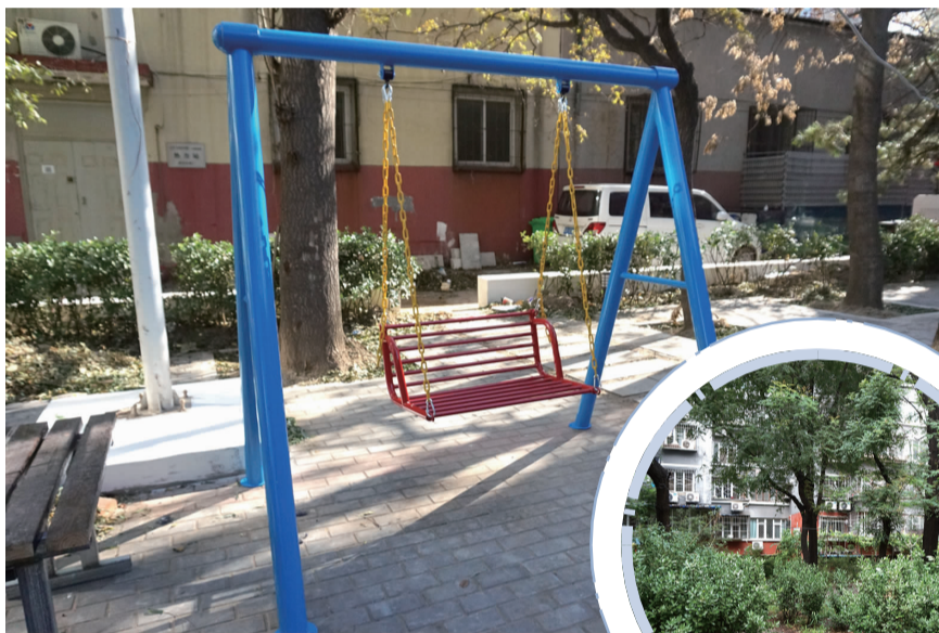
改造后安装秋千供居民使用

除此以外,双井党政群共商共治2021街道级(A类)十大项目还包括双井1·3社区项目、垂杨柳东里地面铺装项目等,其中,社区级居民服务中心建设项目、垂杨柳东里地面铺装项目、垂杨柳南里央企东方石化家属区老旧小区改造提升项目等多个项目已完成。