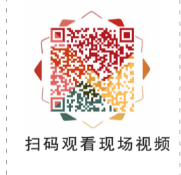
扫码观看现场视频

当前疫情防控形势严峻复杂,为进一步做好常态化疫情防控工作,双井街道将持续开展疫苗接种工作,请还未接种的大朋友、小朋友尽快接种。特别提示,使用“声智健康”小程序即可预约。此外,11月15日至19日,垂东社区活动室亦可接种。