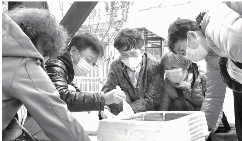
工作人员与居民一起为花箱涂颜料