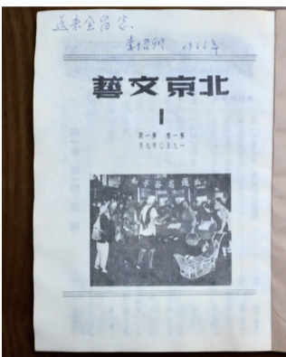
带有师傅留言的杂志内页