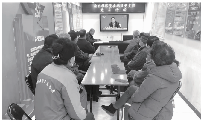
▶ 双井街道各社区组织党员群众学习十九届六中全会会议精神