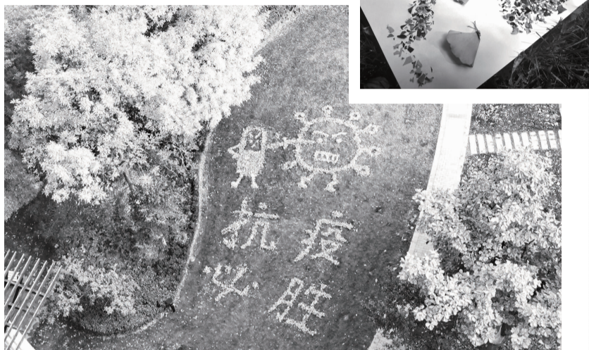
用落叶摆出的景观拼字与纸上作品