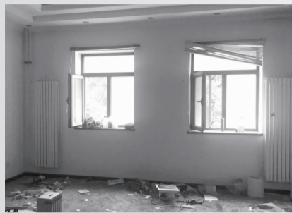
改造前二层空间景象