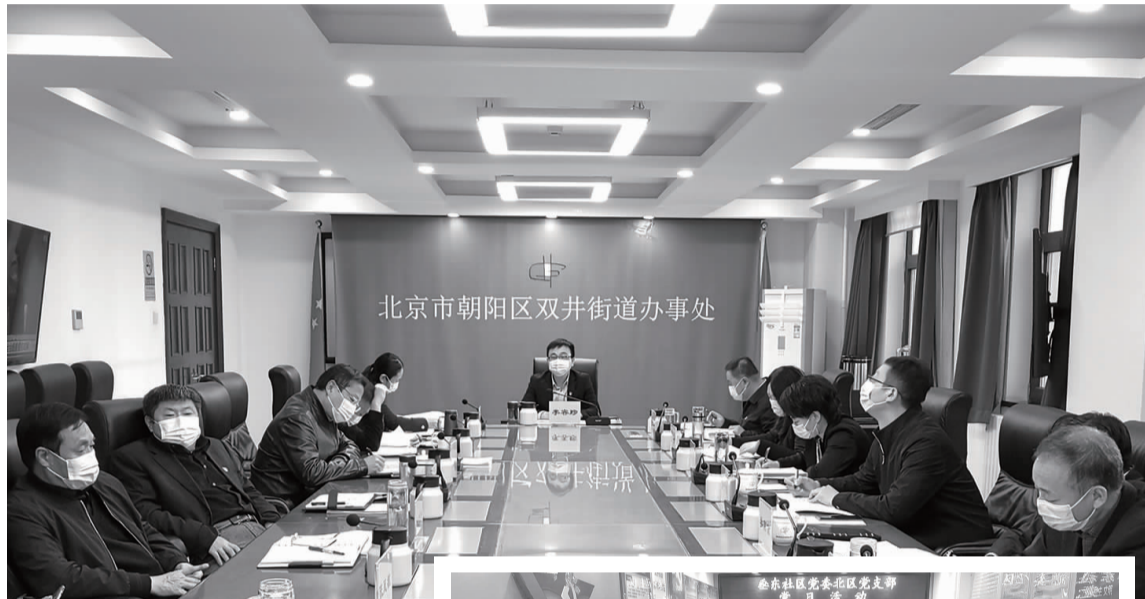
北京市朝阳区双井街道办事处