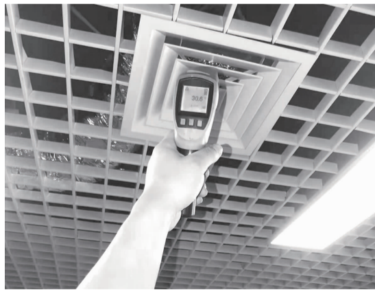
供暖后工作人员实测出风口温度

“来电反映情况的是辖区外企大厦的商户,我们在现场看到室内空调显示实时温度为10度左右,并且不能使用暖风功能。”社区工作人员说道。据了解,由于近期北京气温骤降,根据北京市城市管理委员会印发的相关规定,北京市从11月6日开始