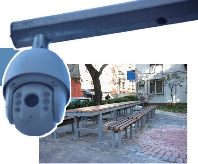
改造后新增阅读角

2021年已经进入尾声,医养结合服务、老旧小区改造、监控安装等党政群共商共治2021年街道级A类项目完成得怎么样了?下面,就让我们一起来看看吧。